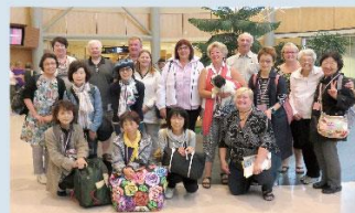
クラスメイトとホストファミリー