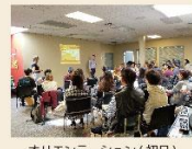
オリエンテーション(初日)