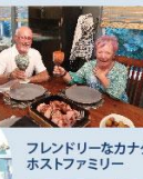
フレンドリーなカナダ ホストファミリー