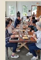
アフタヌンティー